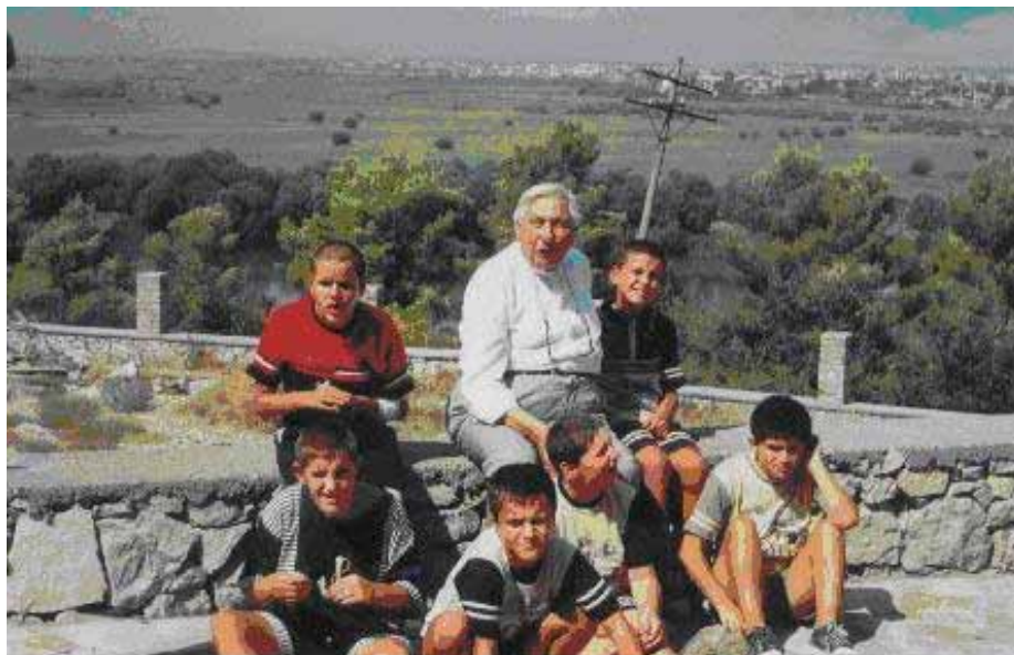
Don Carlo con i ragazzi di Skutari

e delicato compito che i sacerdoti dell'Opera hanno di non snaturarne la storia e le Opere del suo fondatore ma al contempo quello di continuare a rispondere alle nuove povertà della società di oggi.